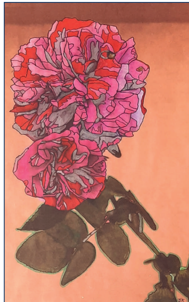
Она и он, 2023.