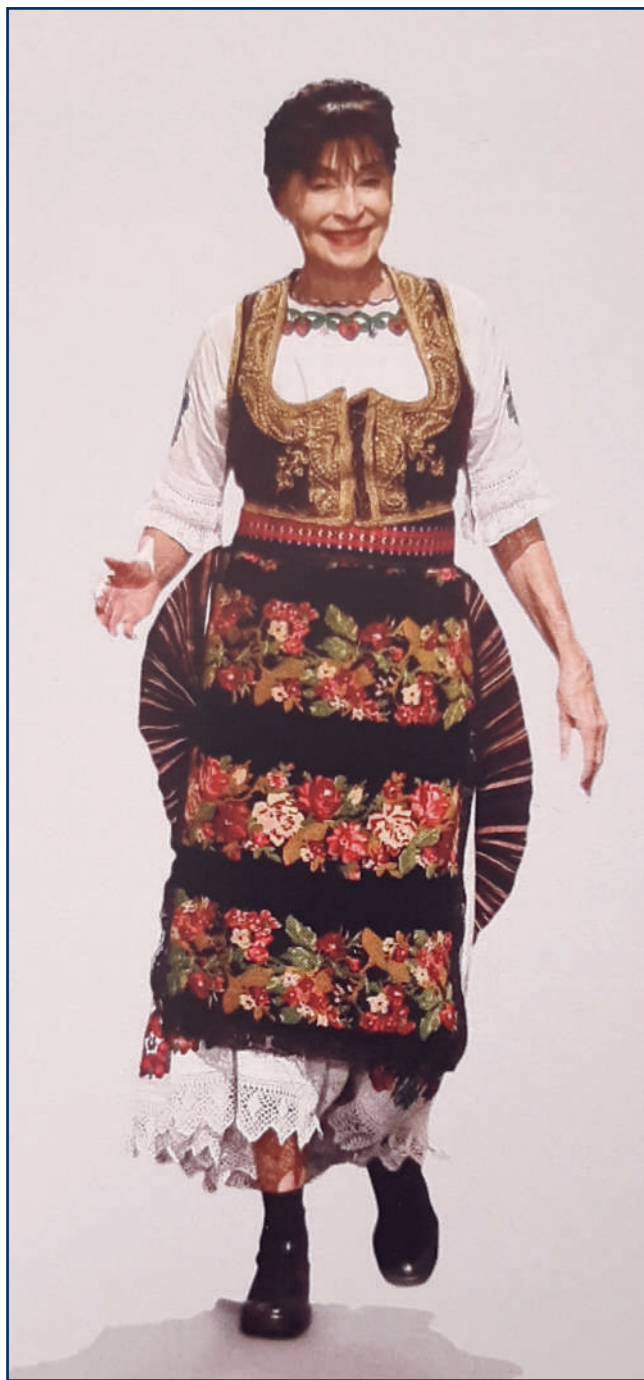
ЊКВ Кнегиња Јелисавета у српској народној ношњи

Једина српска принцеза рођена у Београду, у Белом двору, од свих живих Карађорђевића данас је кнегиња Јелисавета, од оца Павла Карађорђевића, сина кнеза Арсена и руске грофице Ауроре Демидов. Мајка кнегиње Јелисавете била је кнегиња Олга Олденбург, најстарија кћи грчког принца Николе, док јој је бака по оцу била сестра императора сверусије Александра другог, а деда из данске краљевске лозе. Мајка кнегиње Олге је била велика кнегиња Јелена, ћерка кнеза Владимира, другог сина императора сверусије Александра другог Романова.